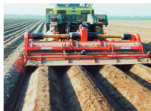
Pflege der Kartoffeldämme