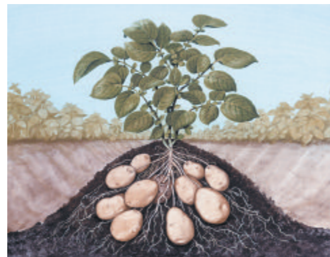
Zeichnung einer Kartoffelpflanze

Die Kartoffelknolle ist keine Wurzel, sondern eine Verdickung jener Stolone. Die junge Knolle ist das Speicherorgan der Pflanze. Wurzeln an der Basis der Sprossachse und an den Knoten der Ausläufer sorgen für die Wasser- und Nährstoffaufnahme. Pro eingepflanzter Kartoffelknolle können in der Regel zwölf bis 15 Kartoffelknollen geerntet werden.