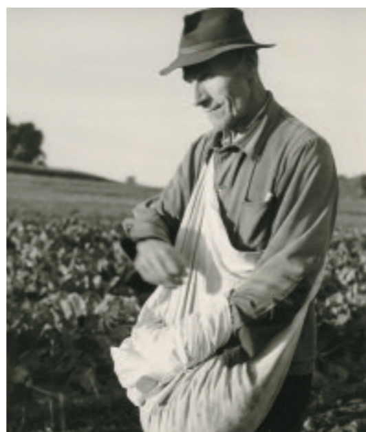
Kartoffellegen früher – von Hand und mit den ersten Hilfsmitteln