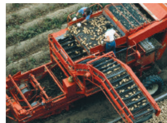
Ernte: Kartoffelroder mit Verladeband