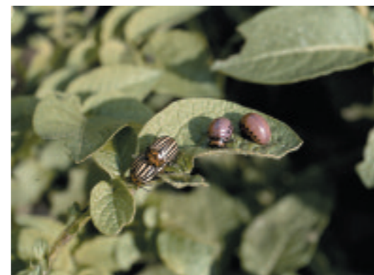
Kartoffelkäfer mit Larven

Eine wichtige Aufgabe des Landwirtes ist es, die Pflanzen zu pflegen und sie vor Schädlingen und Krankheiten zu schützen.