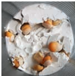
Maiskörner sprengen Gips

Erklärung: Aus dem Gips dringt Wasser in die Samen ein. Dadurch nehmen die Samen an Volumen zu und dehnen sich so stark aus, dass der Gips zerbricht.