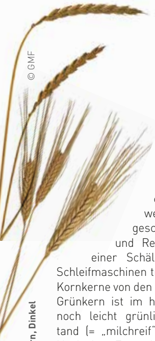
v. u. n. o.: Emmer, Einkorn, Dinkel