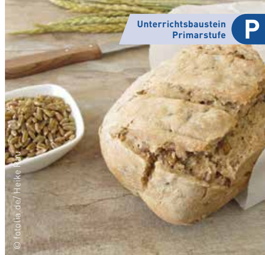
Grünkernbrot mit Körnern und Dinkelähre