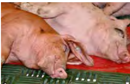
Liegende und ruhende Mast Schweine liegen gerne dicht an dicht.

Bei der Bodengestaltung gibt es viel zu beachten. In der Mast Schweinehaltung hat sich die einstreulose Haltung auf perforierten, trittsicheren Böden als Standardverfahren durchgesetzt. Durch die Schlitz- bzw. Löcher, die zum Schutz der Klauen nicht zu groß sein dürfen, gelangen Urin und Kot in ein Güllebecken darunter und werden ständig entfernt. Das ist wichtig für ein gutes Stallklima und eine hygienische Haltung der Tiere. Betonböden fördern den notwendigen Klauenabrieb und somit die Klauenge-