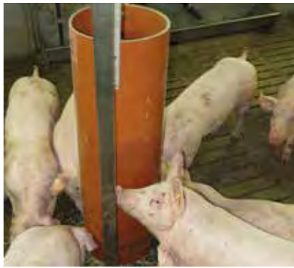
Der Düsener Wühlturm enthält z.B. Stroh, das die Mastschweine aus einem Spalt über dem Podest herauswühlen. Sie beschäftigen sich damit oder fressen es auch auf.

Schweine sind neugierig und haben einen inneren Trieb zum Erkunden ihrer Umwelt. Wie viele andere Tiere beschäftigen sich Ferkel mit Springen, Nachlaufen und Raufen. Die Älteren brauchen anderweitige Beschäftigung und Reize im Stall, sonst wird ihnen langweilig. So ist gesetzlich vorgeschrieben, dass allen Schweinen Beschäftigungsmaterial