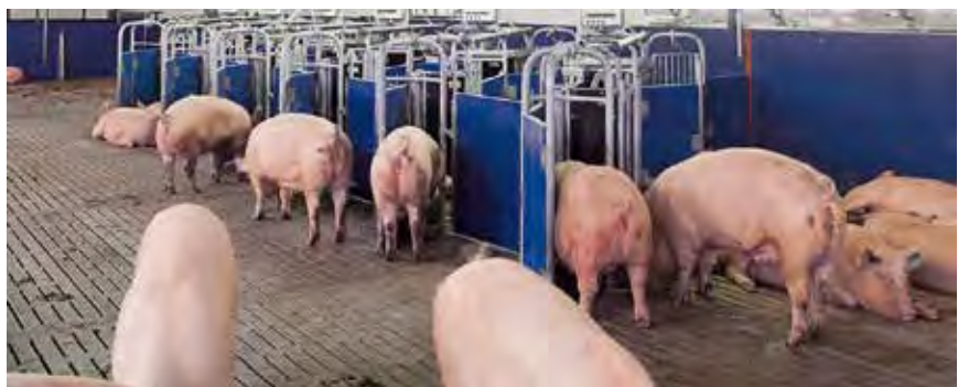
Tragende Sauen werden in Gruppen gehalten. Damit sie optimal fressen, gibt es chipgesteuerte Fütterungssysteme, die auf Abruf jeder Sau genau die Menge und Mischung geben, die sie braucht.

Um das Wohl der Schweine als Nutztiere in Stall- oder Freilandhaltung zu sichern und Abweichungen zu erkennen, muss man wissen, wie sich die Tiere natürlich verhalten und was sie brauchen und bevorzugen. Seit Jahrzehnten entdecken Forscher immer wieder Neues zu den tierischen Vorlieben. Wichtig ist auch die Erfahrung der Landwirte, die ihre Schweine, deren Gesundheit, Verhalten und Leistung tagtäglich beobachten. Das Fachwissen der Mitarbeiter im Stall und ihr Verhältnis zu den Tieren ist ein ganz entscheidender Faktor. Dafür ist es wiederum wichtig, dass der betreuende