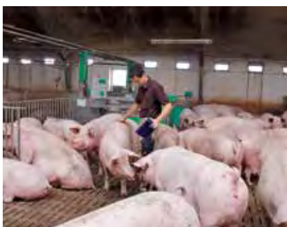
Das Fachwissen der Mitarbeiter im Stall und ihr Verhältnis zu den Tieren ist ein ganz entscheidender Faktor für das Tierwohl.

Von großer Bedeutung ist die Vorsorge gegen die Einschleppung von Krankheitserregern. Risiken sind z.B. Kontakt mit Wildtieren bei Außenhaltung, Vögel, Ratten, Fliegen, Mäuse oder auch Hunde, Katzen und sonstige Tiere im Stall. Auch durch Menschen, Geräte oder über die Luft können Erreger übertragen werden. So sorgt der Landwirt z.B. dafür, dass Fliegen und ihre Parasiten nicht zur nervigen Plage und Gefahr für die Tiere werden. Jedes Ferkel bekommt nach der Geburt eine Ohrmarke, sodass auch nach dem Verkauf an andere Betriebe einfach festgestellt werden kann, aus welchem Betrieb es stammt. Sollte es zur Verschleppung von Krankheitserregern kommen, lässt sich die Infektionskette problemlos zurückverfolgen.