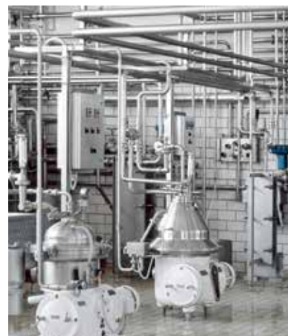
Separatoren trennen Milch mittels Fliehkräften in Magermilch und Rahm.

Viele Molkereien arbeiten rund um die Uhr, um die Produktqualität aller Ver- und Bearbeitungsstufen zu kontrollieren und frische, einwandfreie Milch zu gewährleisten. Jede einzelne Charge lässt sich aufgrund der Kennzeichnung zurückverfolgen. Tägliche Verkostungen geben Sicherheit über die sensorischen Eigenschaften der Milch. Fachleute aus dem Labor und der Produktion wissen genau, wie die Milch schmecken muss. Für alle Produktionsschritte sind bestimmte Sollwerte definiert. Beim Überschreiten der Grenzwerte wird sofort reagiert, um Fehler direkt zu beheben. Die Milchgüterverordnung verpflichtet zusätzlich die Behörden zur Überwachung der Milchqualität im Handel und stellen somit die Qualität der Milchprodukte sicher.